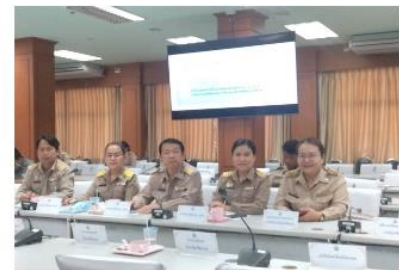
สพป.ศรีสะเกษ เขต 4 ประชุมคณะกรรมการอำนวยการป้องกันและปราบปรามยาเสพติดจังหวัดศรีสะเกษ