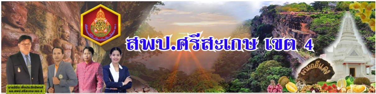
นายลิขิต เพ็งประสิทธิ์พงศ์ ผอ.สพป.ศรีสะเกษ เขต 4

ข่าวประชาสัมพันธ์ ปีที่ 4 ฉบับที่ 35 ลงวันที่ 28 กุมภาพันธ์ 2567