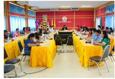
สพป.ศรีสะเกษ เขต 4 ประชุมเตรียมความพร้อมการสอบคัดเลือกเพื่อบรรจุตำแหน่งครูผู้ช่วยกรณีที่มีความจำเป็นหรือมีเหตุพิเศษ