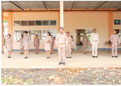
สพป.ศรีสะเกษ เขต 4 เข้าแถวเคารพธงชาติ ทำบุญตักบาตรประจำเดือน พฤษภาคม