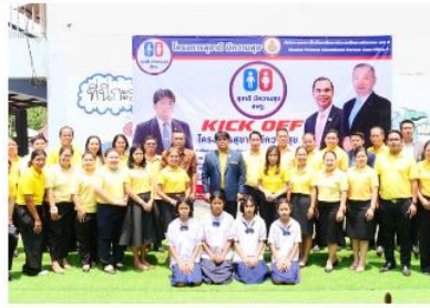
สพป.ศรีสะเกษ เขต 4 Kick Off โครงการสุขภาพดี มีความสุข