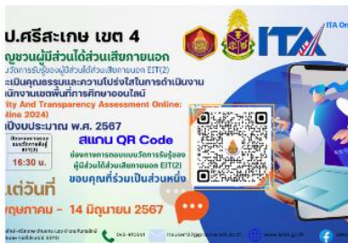
สพป.ศรีสะเกษเขต 4 ขอเชิญชวนผู้มีส่วนได้ส่วนเสียภายนอก ตอบแบบวัดการรับรู้ของผู้มีส่วนได้ส่วนเสียภายนอก EIT(2) การประเมินคุณธรรมและความโปร่งใสในการดำเนินงานของสำนักงานเขตพื้นที่การศึกษาออนไลน์ (Integrity And Transparency Assessment Online:ITA Online 2024) ประจำปีงบประมาณ พ.ศ. 2567