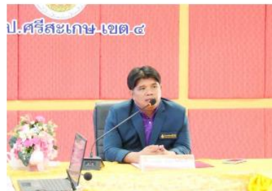
สพป.ศรีสะเกษ เขต 4 จัดประชุมเชิงปฏิบัติการสร้างความรู้ความเข้าใจระบบการจัดเก็บข้อมูลนักเรียนรายบุคคล ปีการศึกษา 2567 ผ่านระบบ ZOOM Meeting