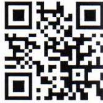
เอกสารแนบท้าย ๑